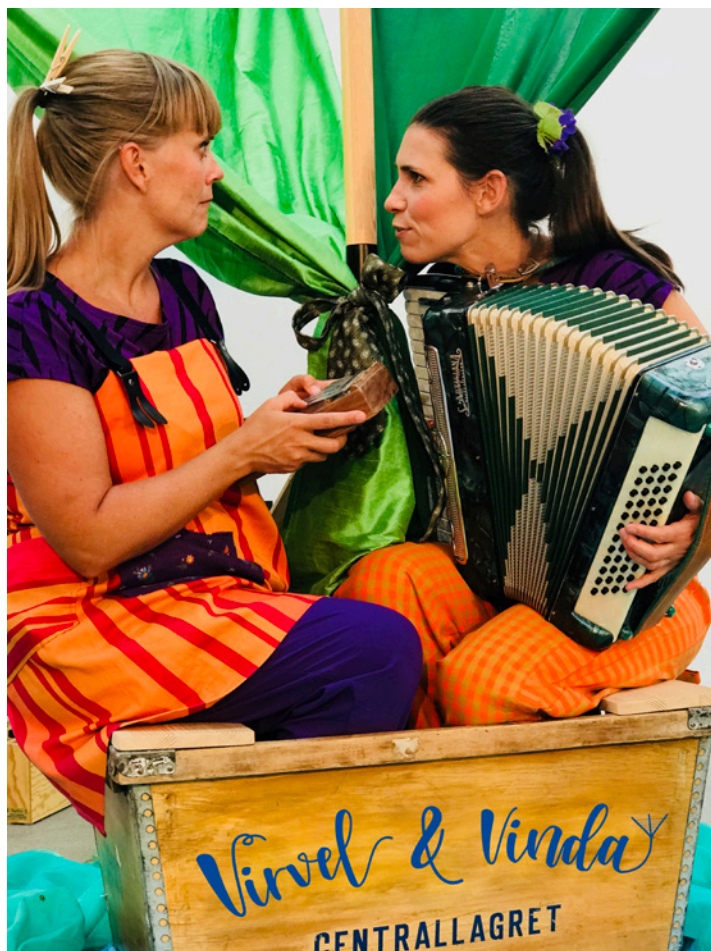
Två medlemmar från Ensemble Yria