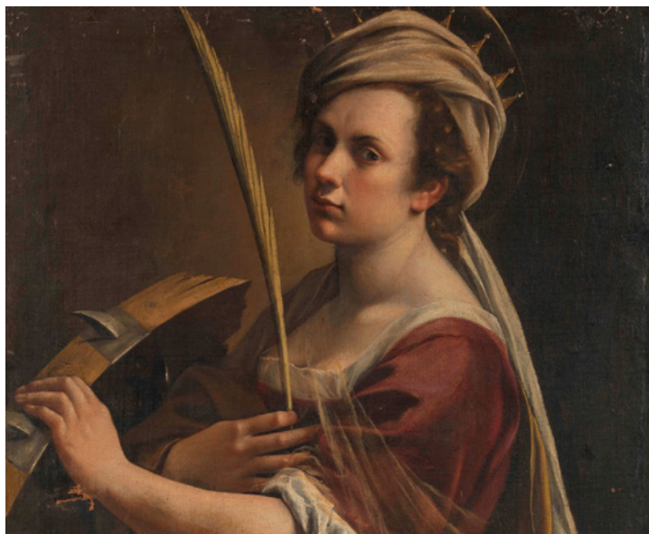
Artemisia Gentileschi, Självporträtt, 1615-17

Operabyrån fortsätter att placera bortglömda kvinnor i rampljuset och att beröra på djupet. Den nya uppsättningen Artemisia är ett drabbande scenkonstverk om mänsklig utsatthet och normbrytande styrka.