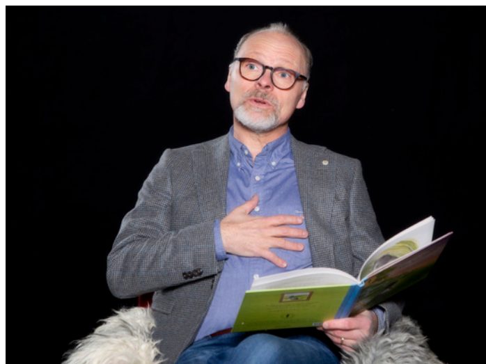
Illustrationer ur "Adjö, herr Muffin", Foto: Anna Wilhelmsson.