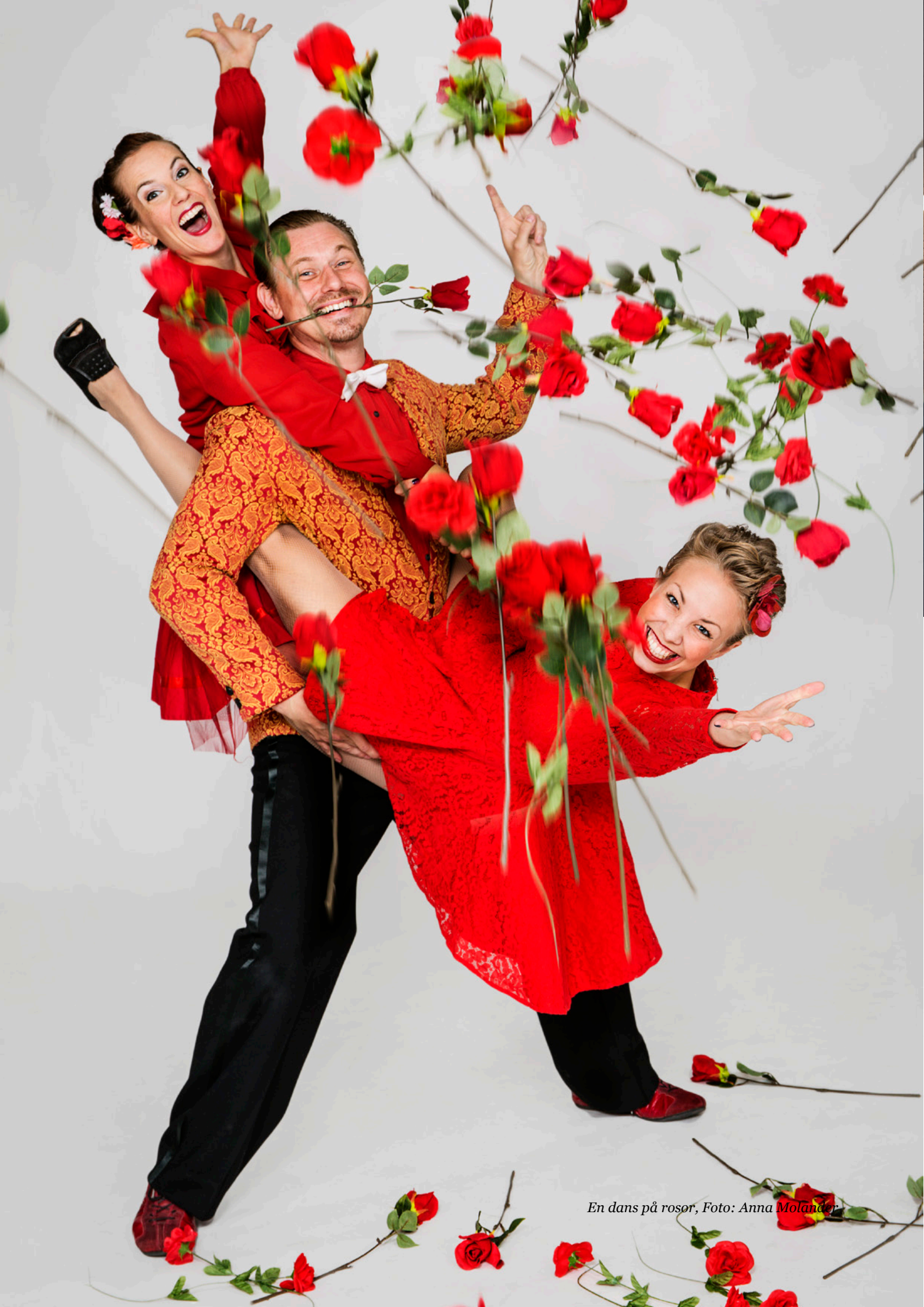
En dans på rosor, Foto: Anna Molander