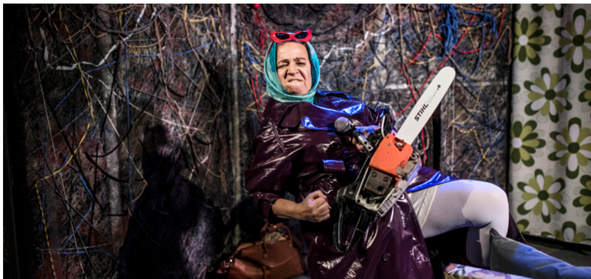
Håriga och Snåriga, Foto: Sandra Lee Pettersson