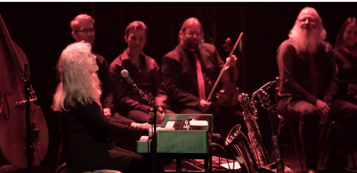
Absolut Jämtland