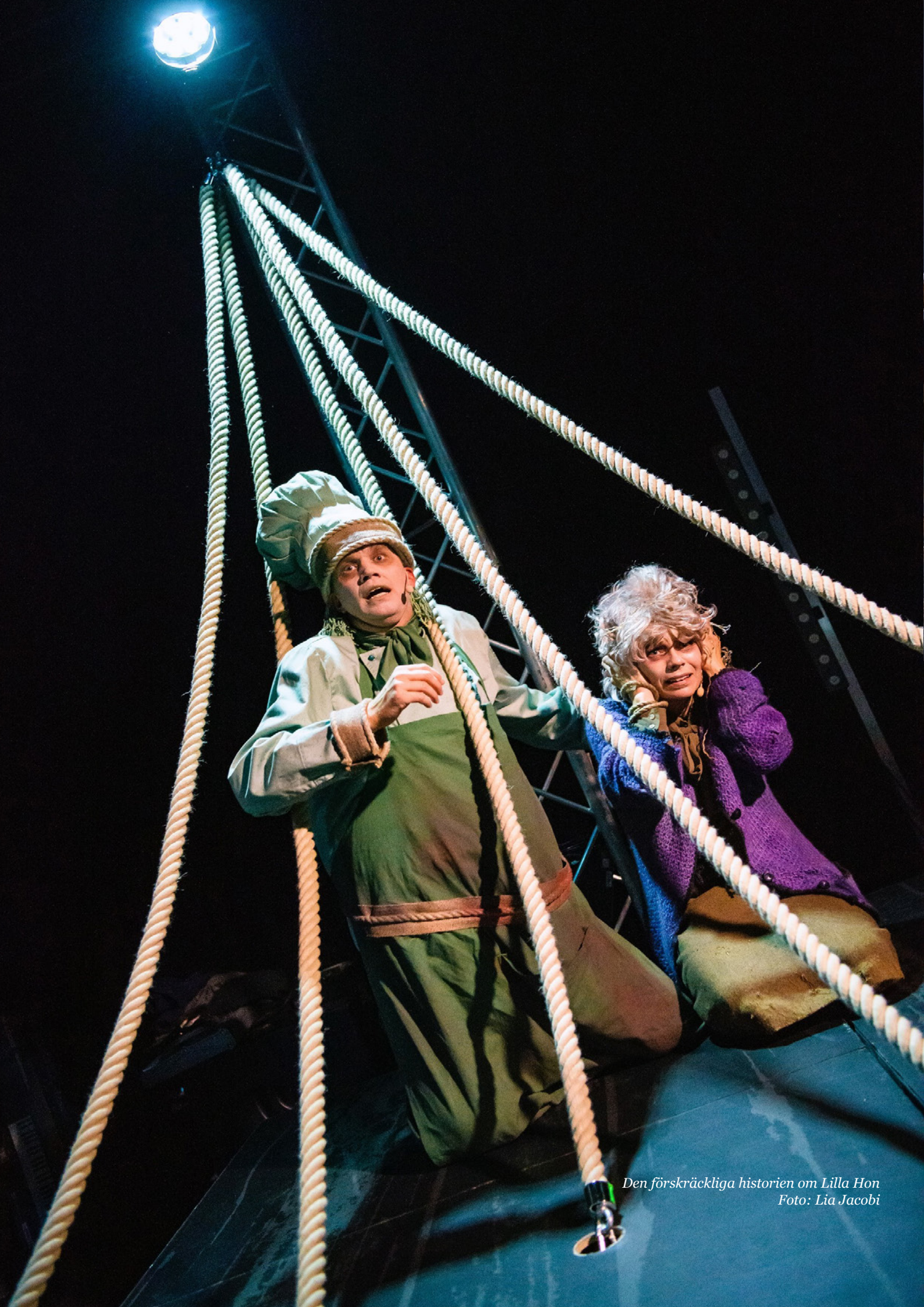
Den förskräckliga historien om Lilla Hon