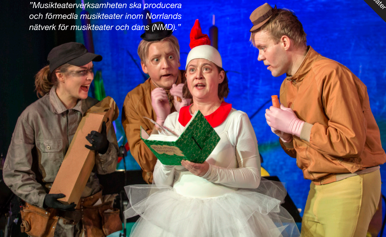
Vem behöver en skatt

"Musikteaterverksamheten ska producera och förmedla musikteater inom Norrlands nätverk för musikteater och dans (NMD)."