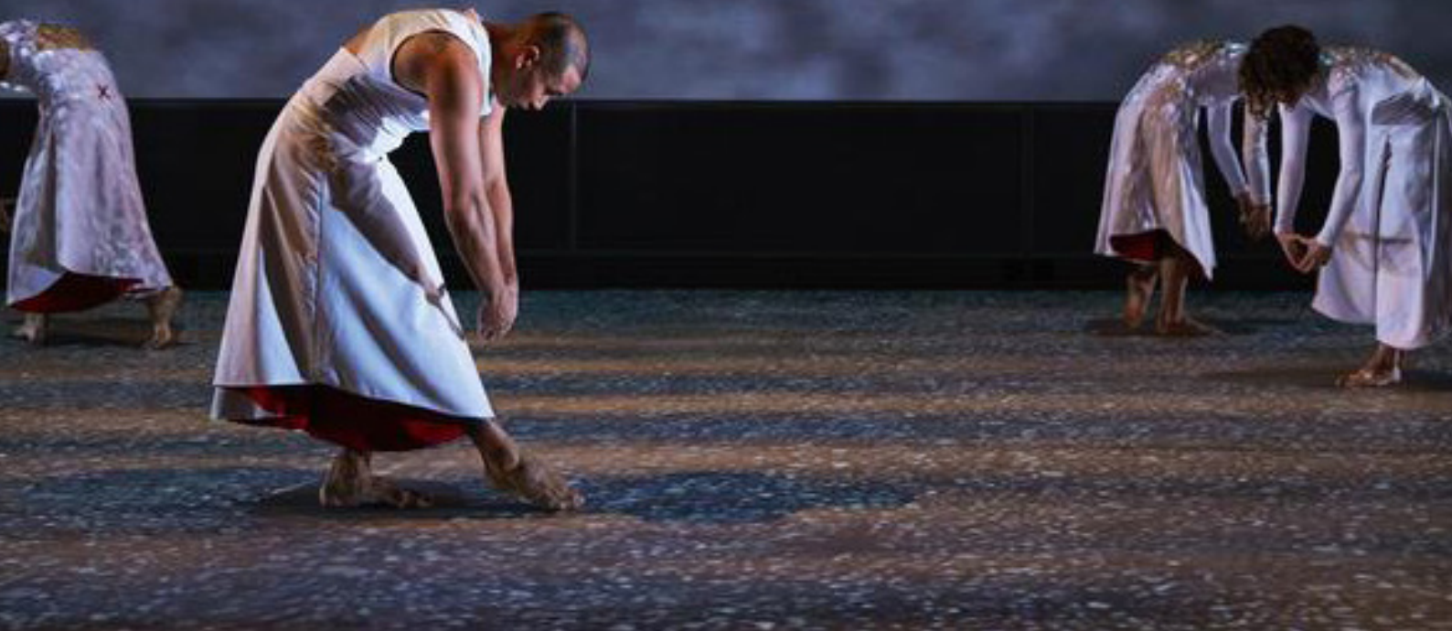
Skies Calling Skies Falling

”Dansen ska leverera kvalitativa produktioner och erbjuda dansworkshops till i första hand skolor och förskolor.”