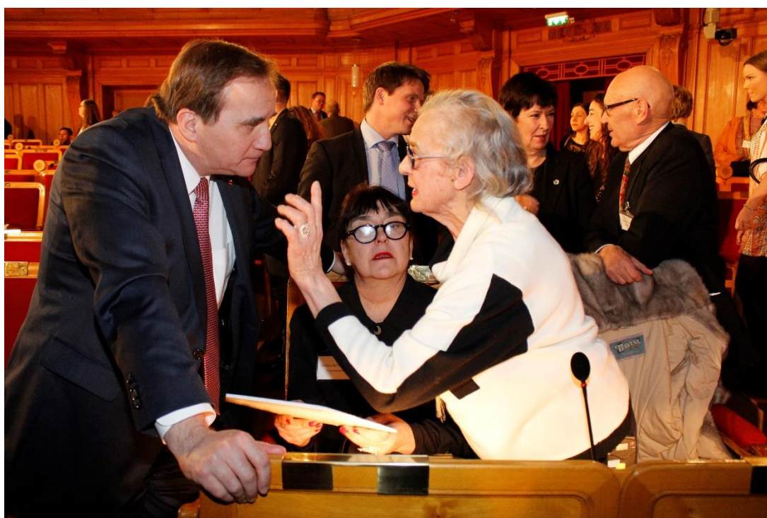
Rosa Taikon i samtal med Stefan Löfvén.

En del utav föreställningen behandlar konstnären och människorättsaktivisten Rosa Taikon (1926-2017), känd för sitt silversmide och sin kamp för romers rättigheter. Rosa levde under många år i Flor i Härjedalen, där hon hade sin verkstad. Numer finns verkstaden och ett flertal av hennes verk att beskåda på Hälsinglands Museum i Hudiksvall. Till utställningen finns ett handledningsmaterial för pedagoger, med tips på övningar kopplade både till konst och mänskliga rättigheter. Handledningsmaterialet går att ladda ner som PDF på Hälsinglands Museums hemsida, där det också finns länkar till filmer om Rosa, om Sveriges nationella minoriteter och om romsk historia.