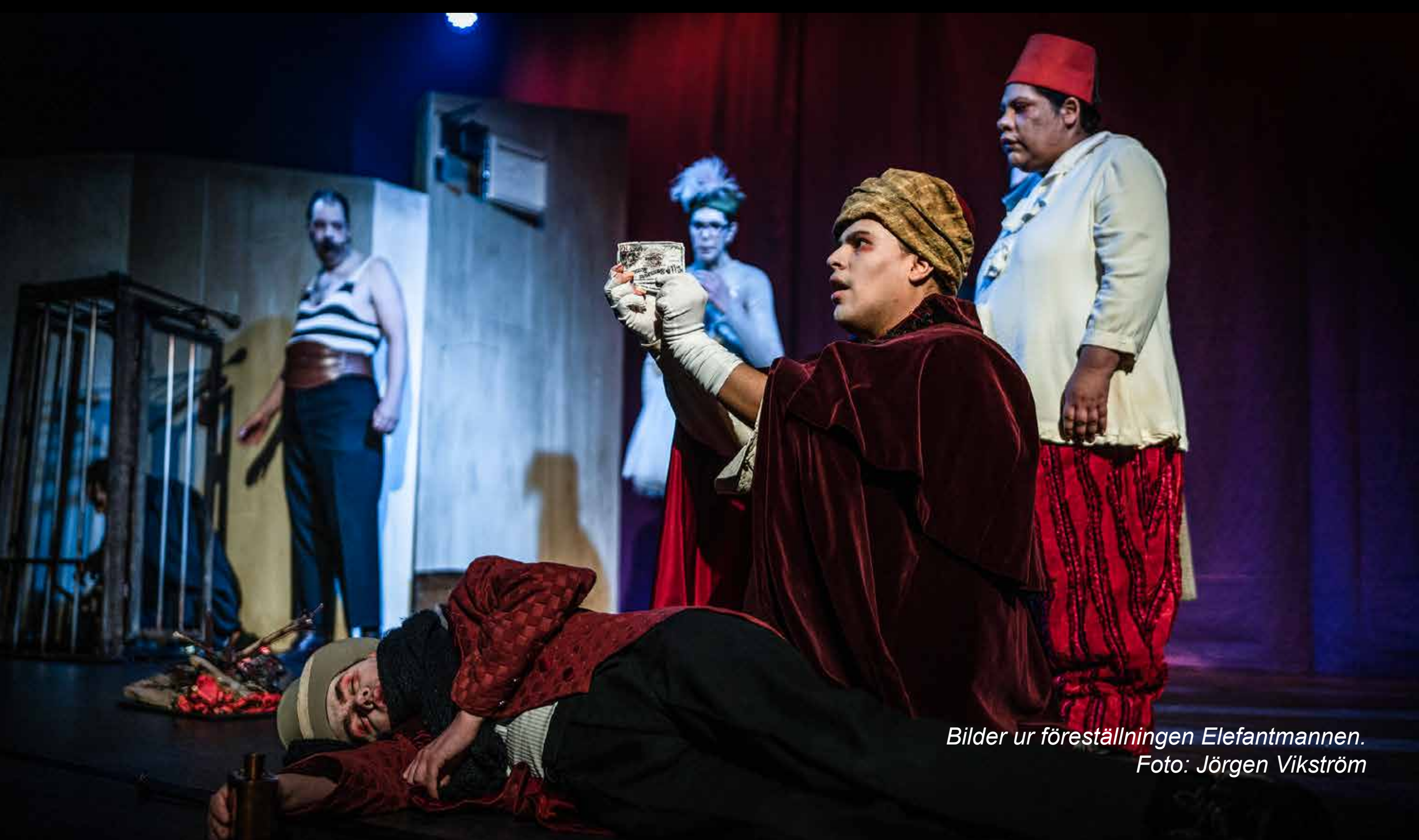
Bilder ur föreställningen Elefantmannen .