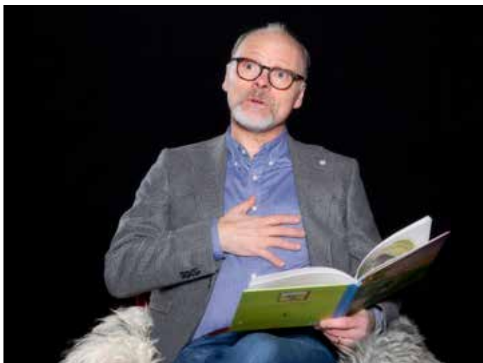
Illustrationer ur "Adjö, herr Muffin", Foto: Anna Wilhelmsson.