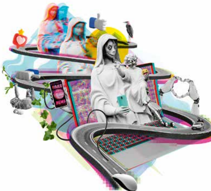
Illustration: Ivar Martinsson

Ja skiter i att det är fejk det är förjävligt ändå är en svart komedi om hur en snöboll kan bidra till att starta en ostoppar lavin på nätet. Kampen mellan tillit och misstro. Om en blind fläck i vår tid; osanningar på nätet, fejkade berättelser och vikten av källkritik.