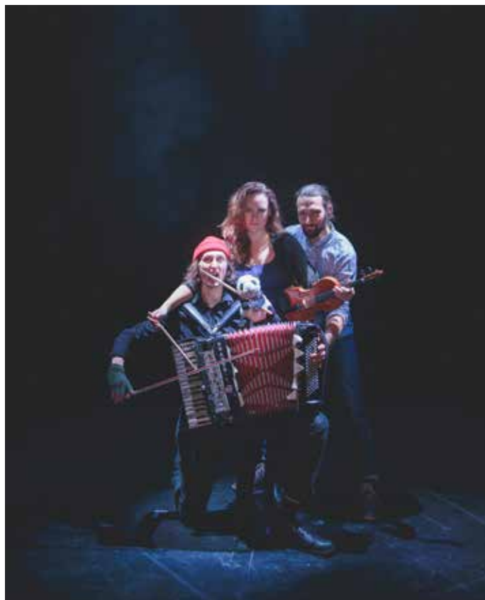
Trio Katastrofa.

Matija är dessutom flitigt anlitad världen runt med dockteater, både som regissör och skådespelare.