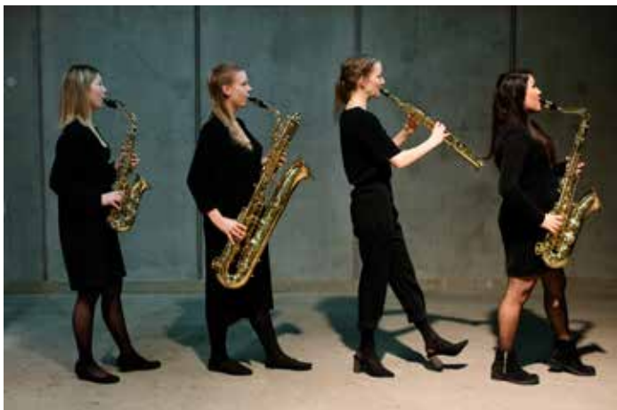
Ensemble Eiradís.