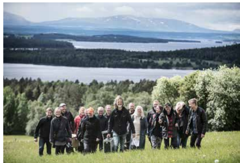
Personalen på Estrad Norr 2018.

Har du aldrig bokat vårt utbud tidigare? Hör av dig så berättar vi mer!