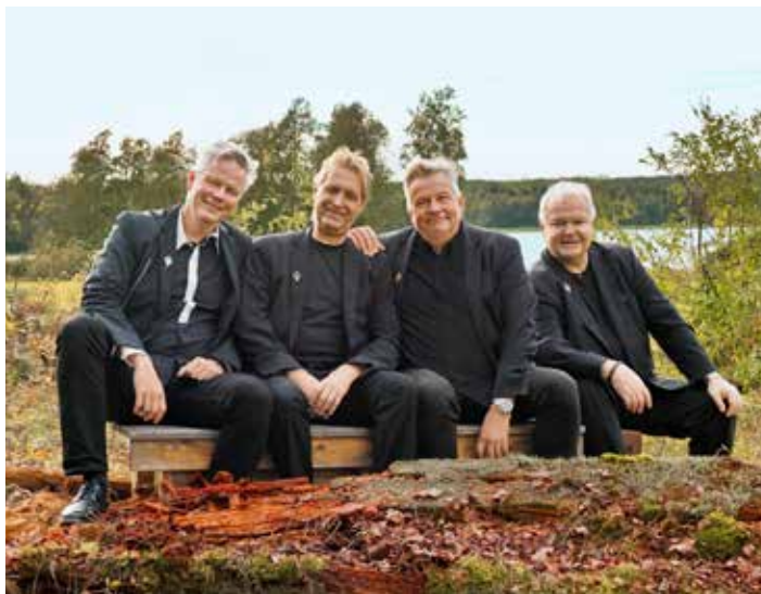
J.P. Nyströms orkester.

I dag – 43 år senare – har musikgruppen J.P. Nyströms spelat tusentals konserter och turnerat över hela världen. Efter decennier tillsammans fortsätter samma pojkar, män och gubbar envist att spela den musik som grep dem redan som barn och som sedan stakade ut livet.