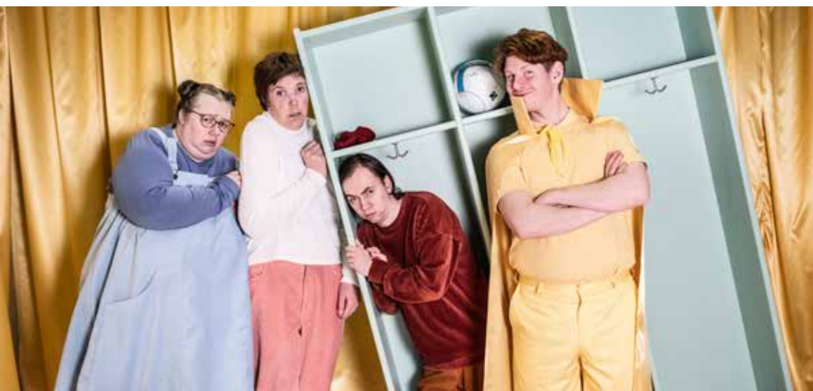
Börja skolan – en liten skräckis för 6-åringar.