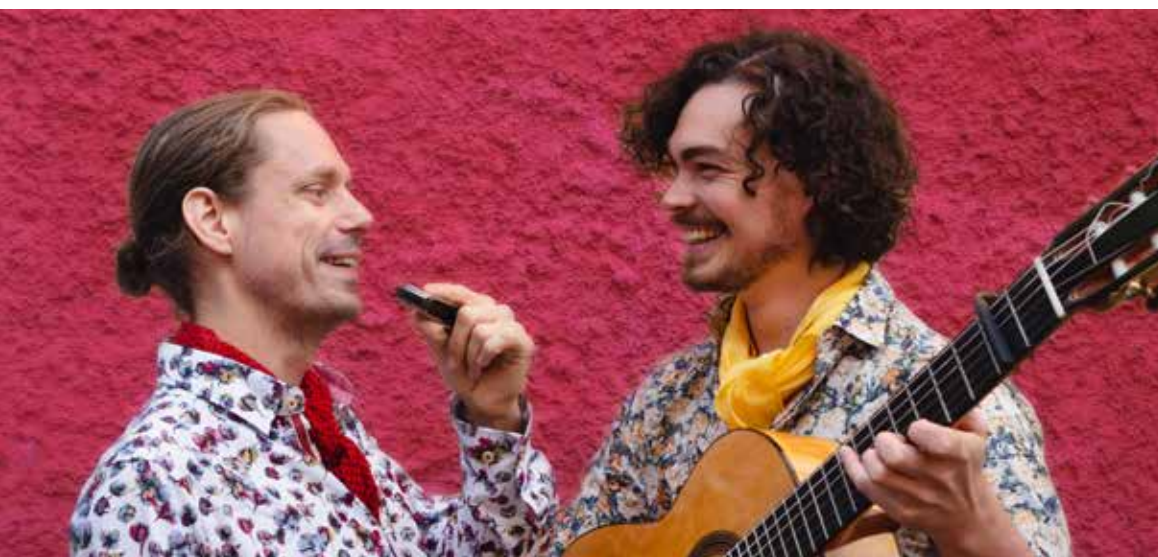
Flamencoduon Chicos Fritos turnerade i Jämtland 2020.