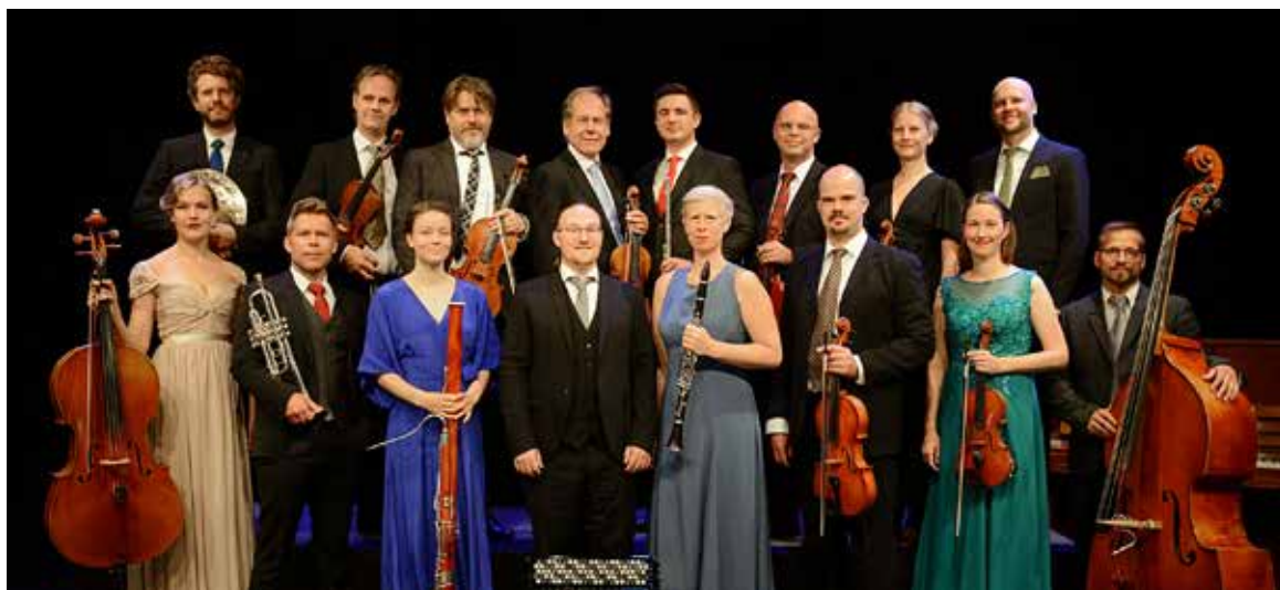
Jemtlands Salongsorkester består av 16 musiker med anknytning till Jämtland.