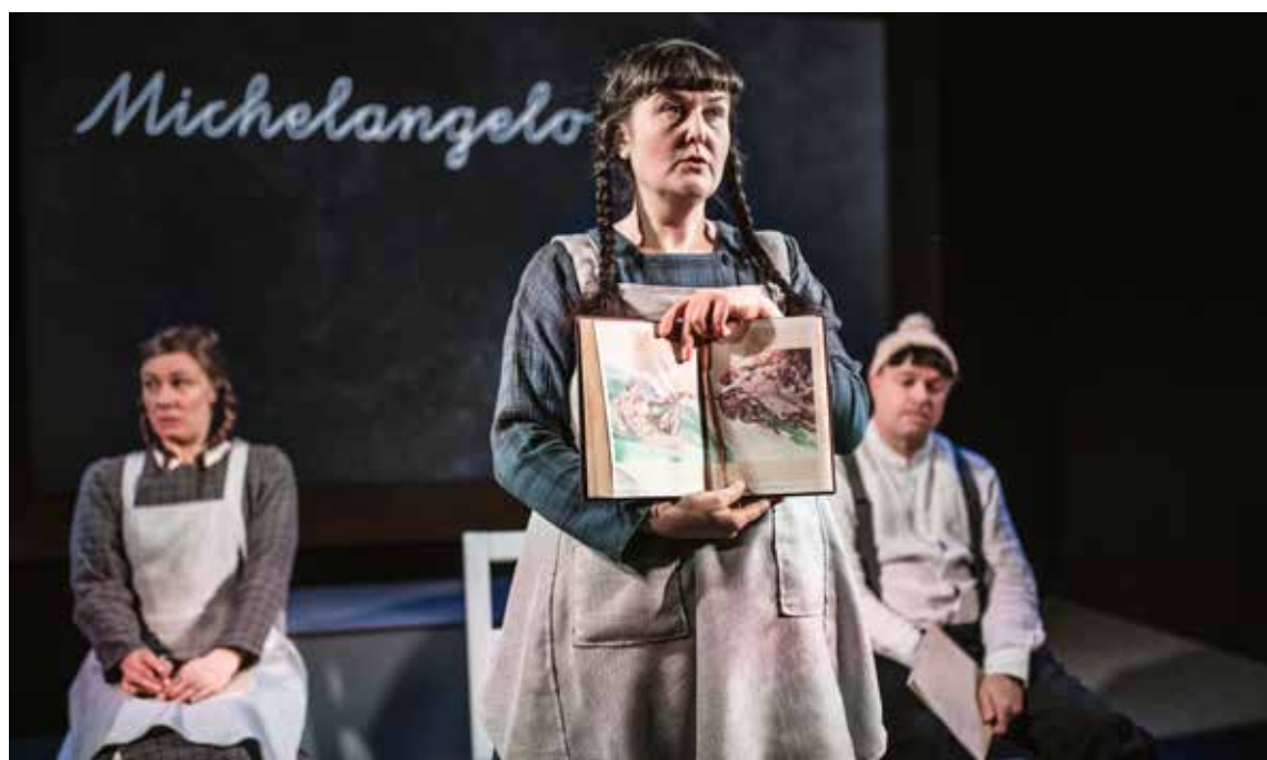
Fågeln i mig flyger vart den vill hade premiär våren 2020.