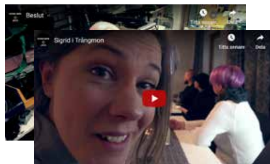
Estrad Norrs digitala scen hittar du på: www.estrادنorr.se/digitalscen

Nämnas bör även projektet som Dramaten startade: Osäkerhetens tid . Vårt bidrag blev en tre minuters, specialskriven version av Versioner – teaterns produktion från 2019.