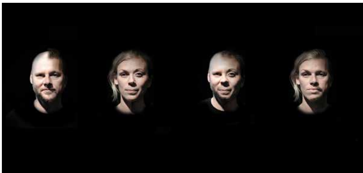
Human – Observation of mankind hade urpremiär i januari 2020.