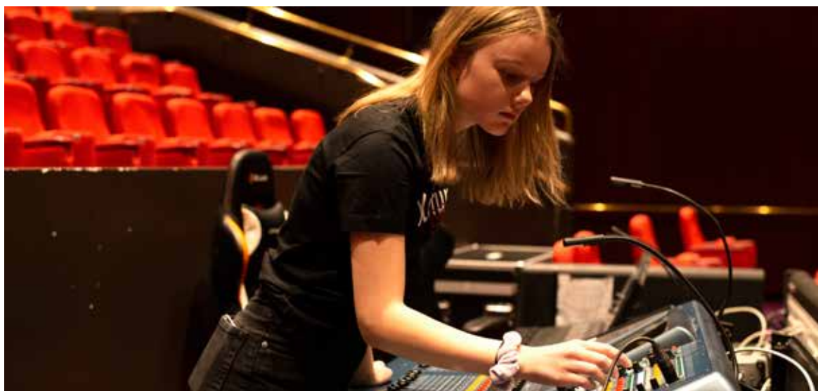
Projektet KulturCrew riktar sig till ungdomar i åldern 12-18 år.