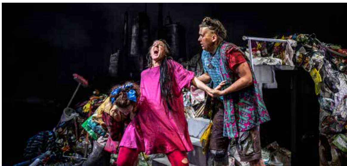
De som kom över havet 2021.