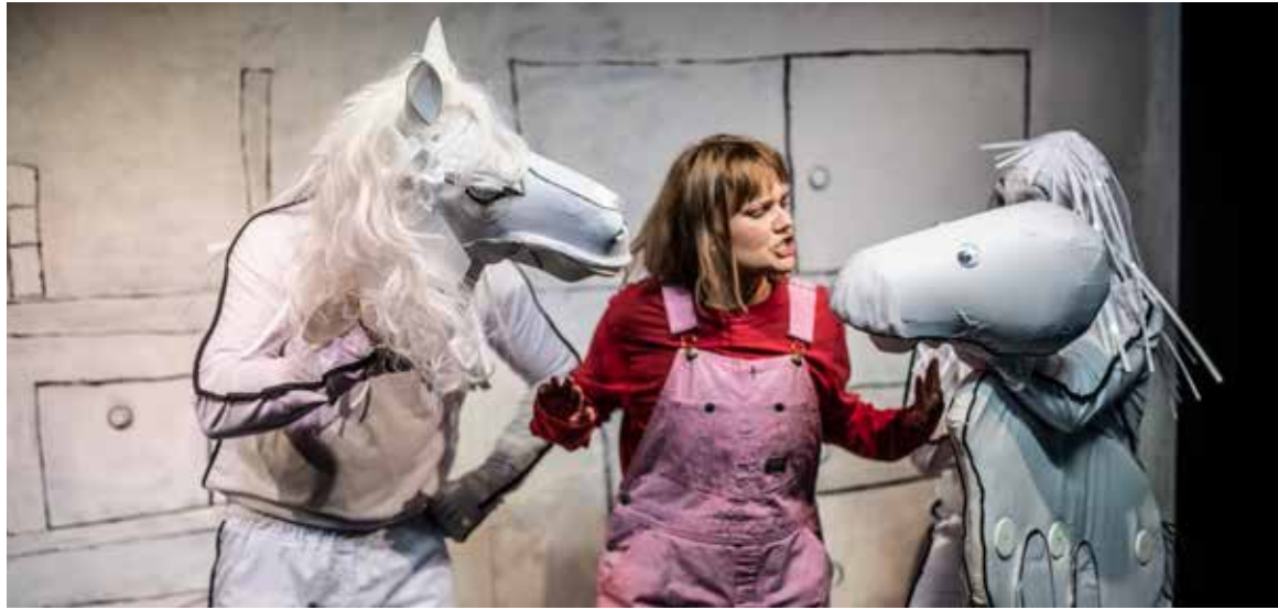
Hästborttagningen spelas i Estrad Norrs mobila scenskåp.