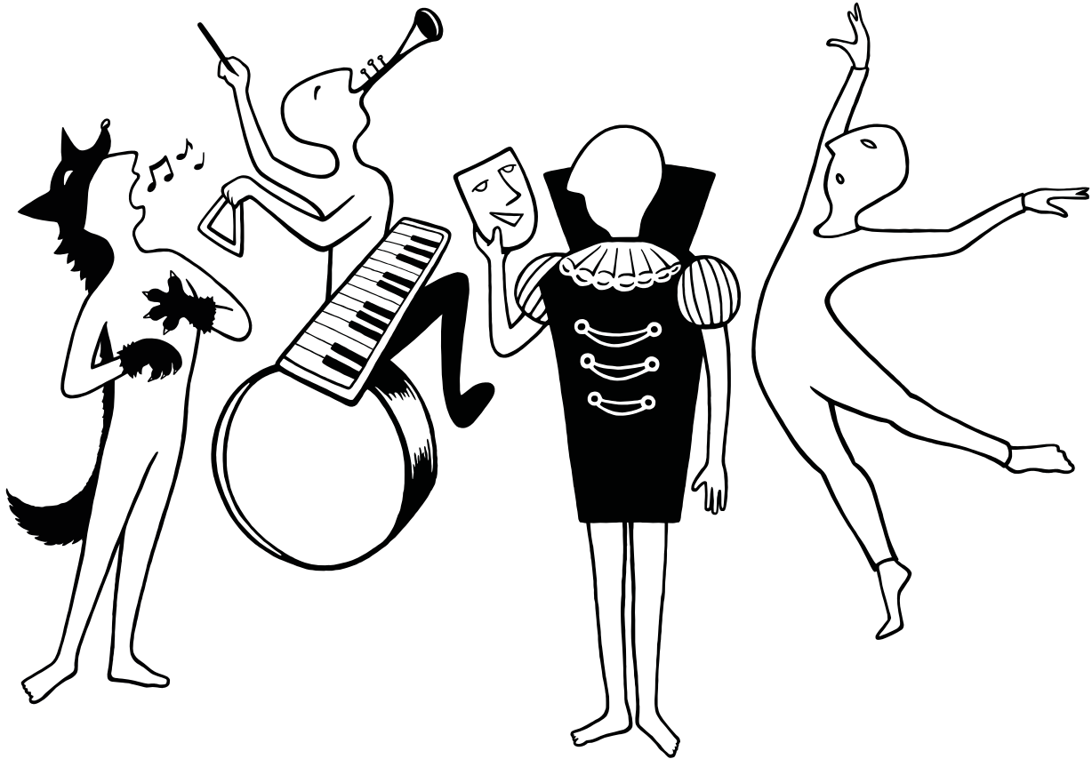
Illustration av Malin Almén