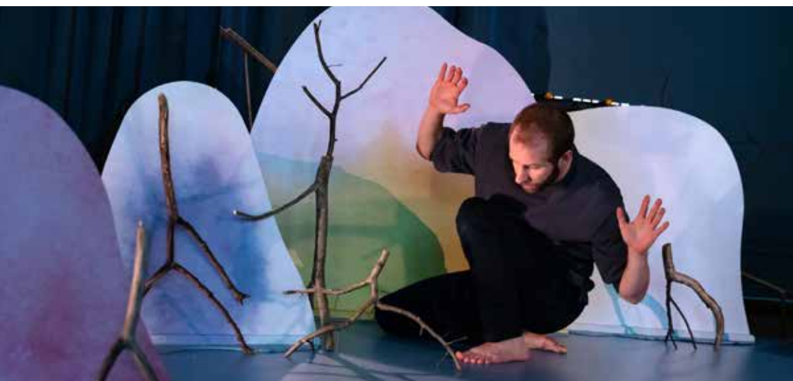
Föreställningen Bludderblad turnerade med Estrad Norrs mobila scen – Skåpet.