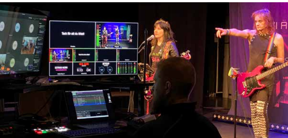
Interaktiv livestreamad konsert med Vi älskar rock .