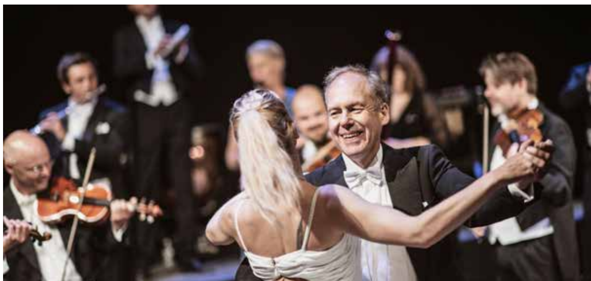
Årets tema för Jemtlands Salongsorkester var dans.