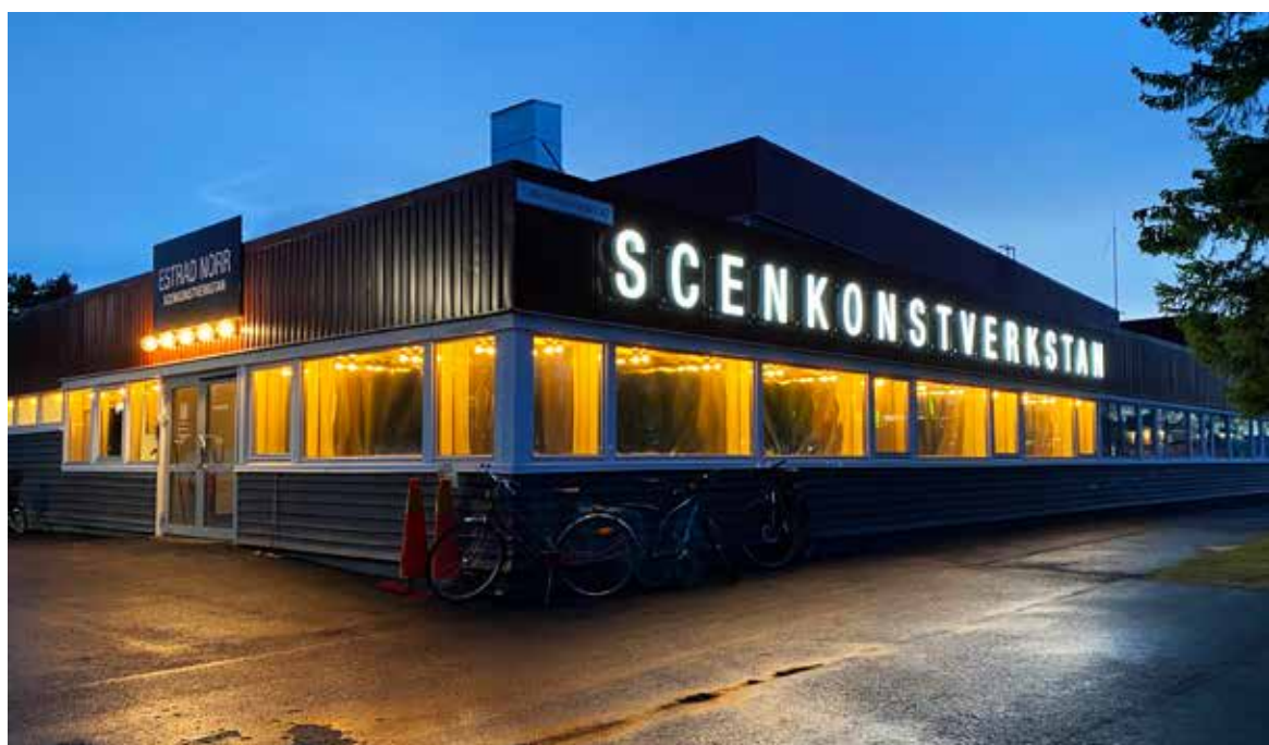
Scenkonstverkstan – Estrad Norrs nya lokal.