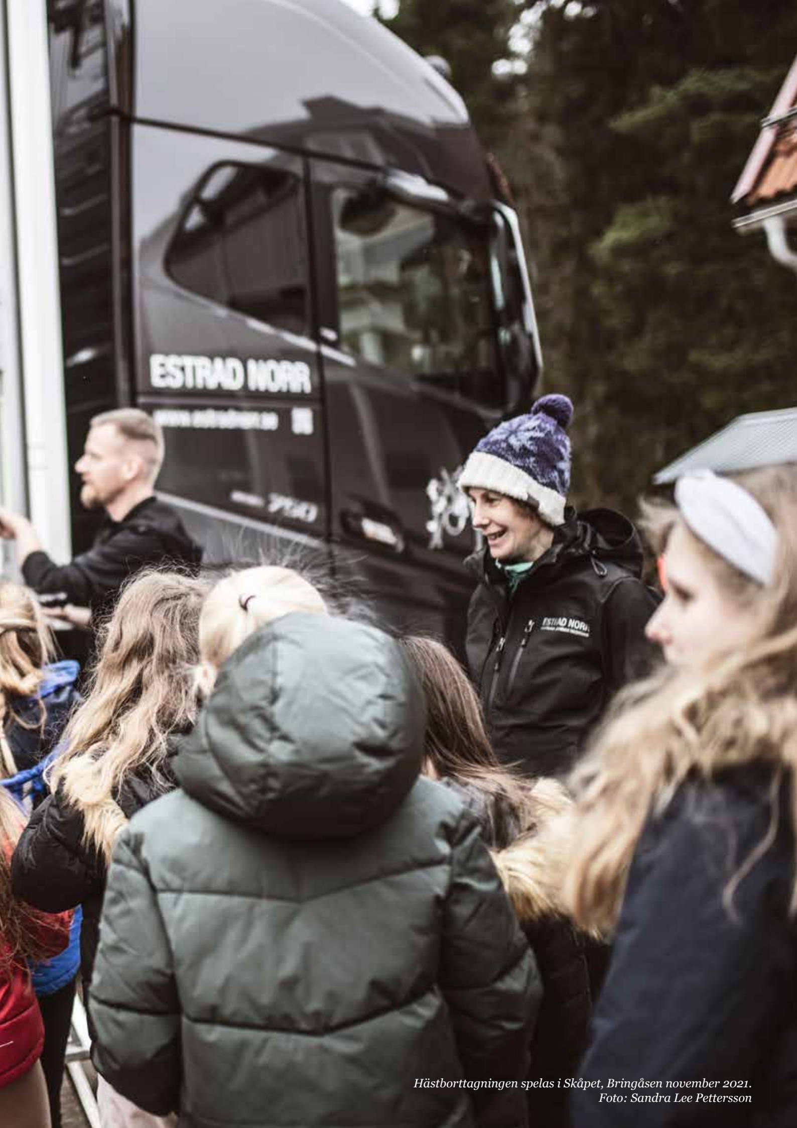
Hästaborttagningen spelas i Skåpet, Bringåsen november 2021.