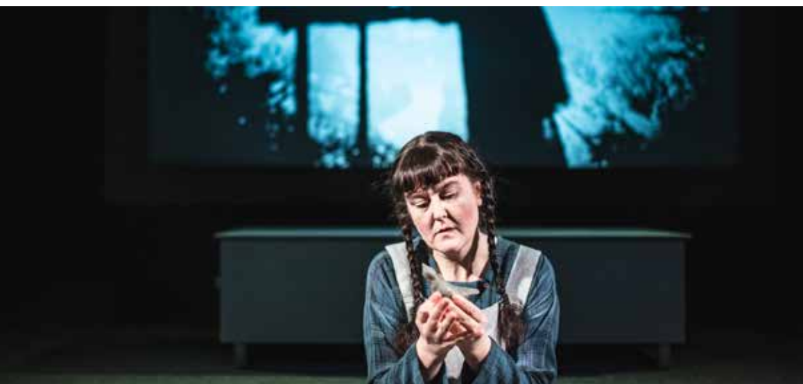
Fågeln i mig flyger vart den vill.